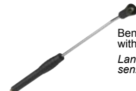
Bent lance with detergent head, without nozzle Lancia angolata con testina detergente, senza ugello