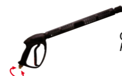
Gun GH 351 with Swivel (n. 2 o-ring) Pistola GH 351 con Swivel (n. 2 o-ring)