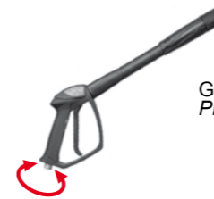
Gun GH 301 with Swivel Pistola GH 301 con Swivel