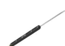
Bent lance, with nozzle holder, without nozzle Lancia angolata, testina portaugello, senza ugello