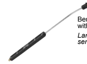
Bent lance with detergent head, without nozzle Lancia angolata con testina detergente, senza ugello