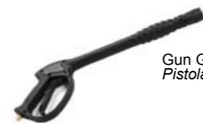
Gun GH 251 with protection Pistola GH 251 con protezione